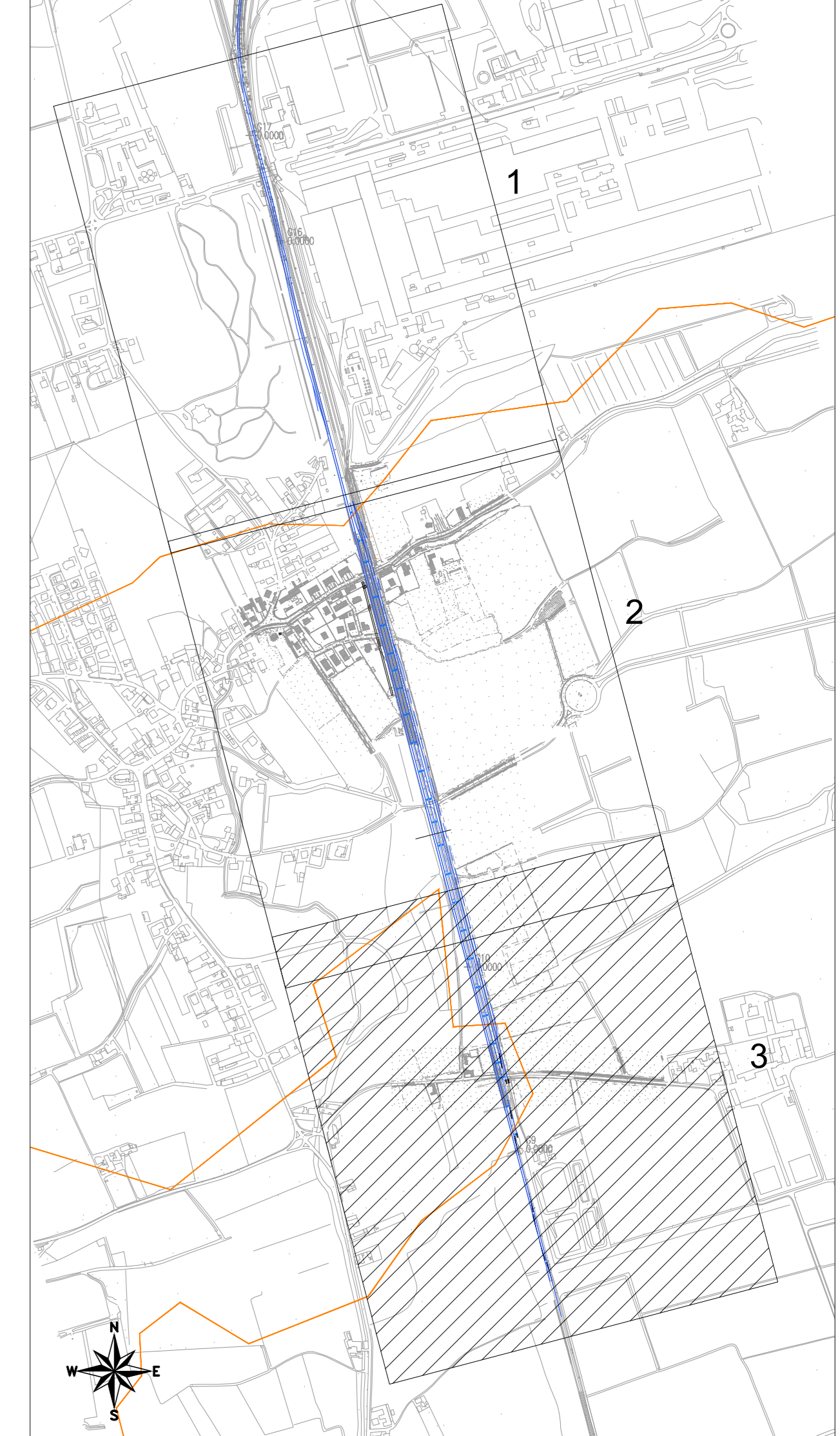
SCALA GRAFICA 1:1000 0m 10 20 30 40 50m