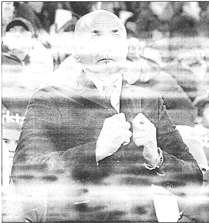
TOP Luciano Spalletti, 57 anni, ha il record romanista di punti in un anno solare: 86 nel 2006