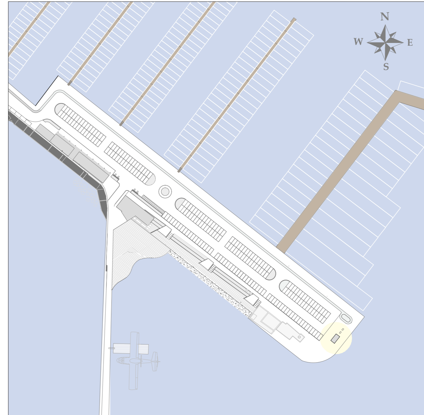
PLANIMETRIA DI RIFERIMENTO